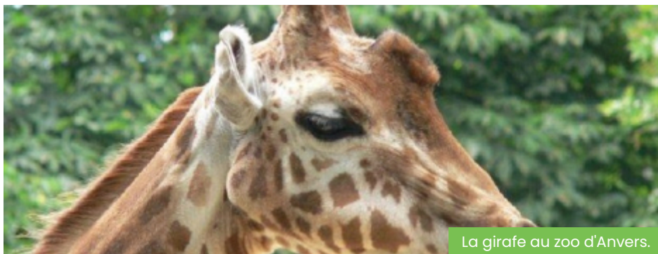
La girafe au zoo d'Anvers.

07h30: départ de métropole Lilloise 10h00: arrivée et journée libre au zoo d'Anvers 17h30: départ du Zoo 20h00 : retour vers votre ville.