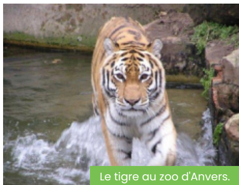
Le tigre au zoo d'Anvers.

07h30: départ de métropole Lilloise 10h00: arrivée et journée libre au zoo d'Anvers 17h30: départ du Zoo 20h00 : retour vers votre ville.